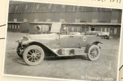
Een jeep staat klaar voor de reusachtige hal van Gontrode. 1917