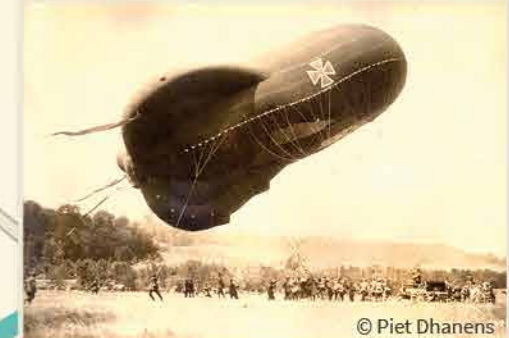
Het varken van de keizer, Duitse verkennersballon. 1915

PROEFSTATION PLANTENZIEKTEN EN INSECTENKUNDE, ILVO