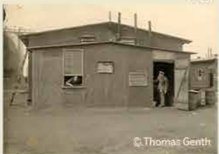
Wat schaft de pot vandaag? De keuken van het vliegveld. 1917