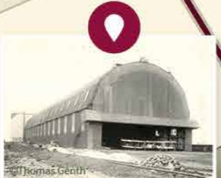
De zeppelinhal op het vliegveld van Gontrode. 1917

Moandagmorgen rond den tweeën Hemme wij em were geziene En hij stond in vlamme en vier Ja neu hangen ze te druugen Op den berg al in de buumen Den ienen oan nen tak En den anderen deur een dak Ja den Engelsman die hee hem g'had.