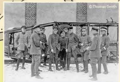
Het England Geschwader (alle vliegeniers die Groot-Brittannie als missie hebben) is deels op het vliegveld van Gontrode gestationeerd en staat er ontspannen bij. 1917