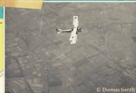
Een Gotha vliegtuig boven Vlaamse velden. 1917